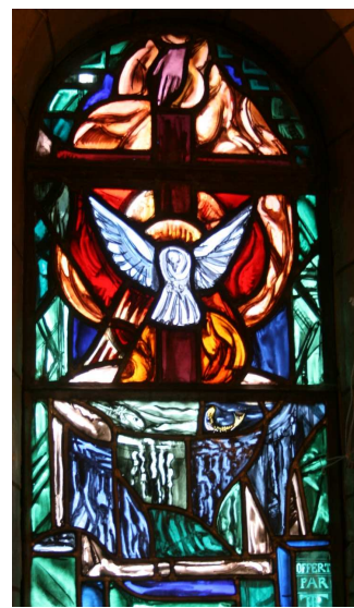
C. G. Eglise de Sannois, baptistère décoré par Valentine Reyre

Le vitrail de Valentine Reyre, à l'église Saint-Pierre-Saint-Paul de Sannois, rassemble plusieurs images du Saint Esprit : la main céleste bénissante, la colombe, les langues de feu, la source d'eau qui purifie et rafraîchit, le tout irradiant la lumière de l'Amour divin, par l'auréole de l'oiseau, le cercle derrière la croix qui évoque le soleil et l'hostie, les effets irisés de l'eau qui s'écoule de la fontaine baptismale, lumière magnifiée lorsque les rayons du soleil naturel traversent la verrière.